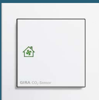
CO 2 -Sensor, Gira E2 reinweiß