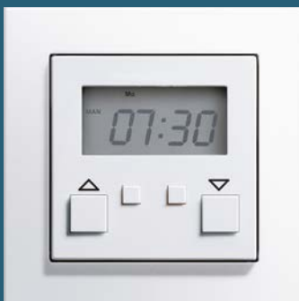
Jalousiesteuerung easy, Gira E2 reinweiß