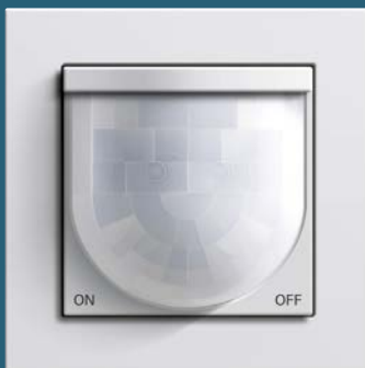
Automatikschalter Komfort, Gira E2 reinweiß