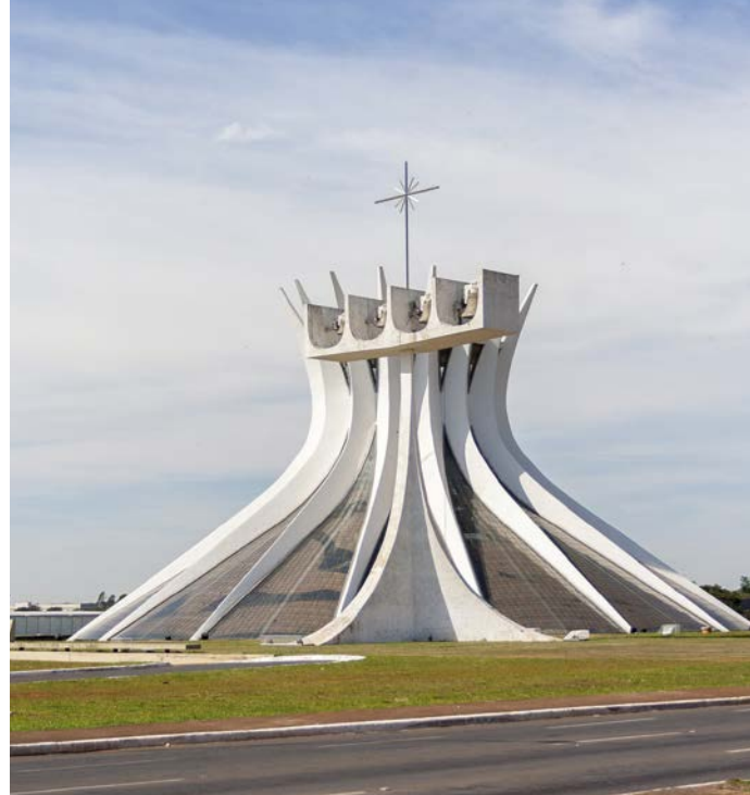
Praça dos Três Poderes in Brasília

Brasilien ist gigantisch und ein Land mit Gegensätzen, Klischees, Temperament, Lebensfreude und einer unbändigen Leidenschaft fürs Feiern, für den Karneval und den Nationalsport Fußball. Bleibt abzuwarten, wer in diesem Jahr den goldenen FIFA-WM-Pokal in den Himmel streckt.