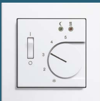
Raumtemperaturregler, Gira E2 reinweiß