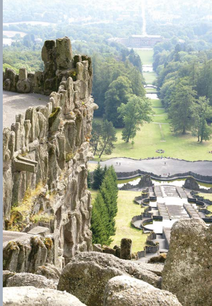
Blick über den Bergpark

Zu Fuß ist es kein einfaches Unterfangen, die rund 300 Höhenmeter zu bewältigen. Und doch zieht es jeden Sommer Tausende von Menschen aus aller Welt hinauf zur Statue. Nicht allein, um den geraden, unverbauten Blick auf Schloss und Stadt zu genießen. Auch nicht, um über märchenhaft verschlungene Wege durch den Park zu schlendern und die Ruhe zu genießen.