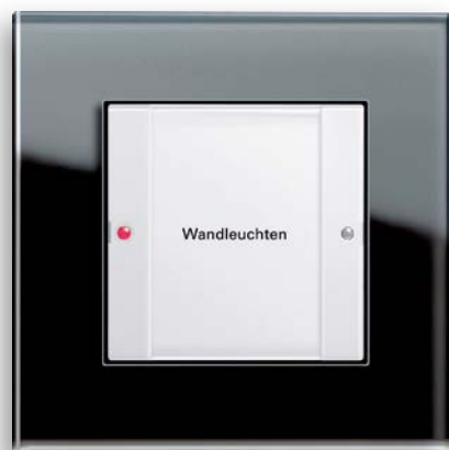
Funk-Wandsender, Gira Esprit Glas Schwarz

Die Installation und Inbetriebnahme des Gira eNet Systems ist denkbar einfach und intuitiv verständlich. Alle Komponenten sind darauf ausgelegt, flexibel, austauschbar und jederzeit erweiterbar zu sein. Standardanwendungen können mittels Push-Button-Methode an den Geräten selbst eingestellt werden. Komplexe Anwendungen lassen sich schnell, einfach und komfortabel mit einem Computer und dem Gira eNet Server programmieren. Beide